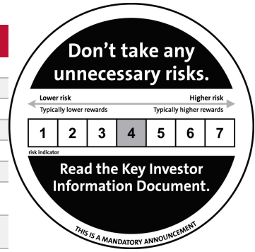
Gráfico de rendimientos